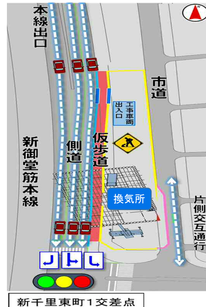
新千里東町1交差点