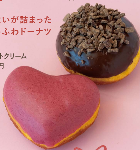
ザクザクチョコ 340円