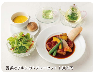
野菜とチキンのシチューセット 1,800円

〒豊中市新千里南町3-1-14 ナカニビル1F ☎06-6319-9187 (ペット同伴は予約制) ①11:00~15:30 (L014:00)、17:00~22:00(L020:30) Ⓜ火曜、不定休 📍桃山台駅北改札出口から徒歩10分