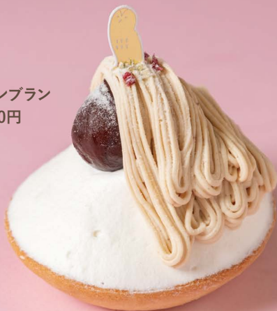
iroha cannele 400~450円