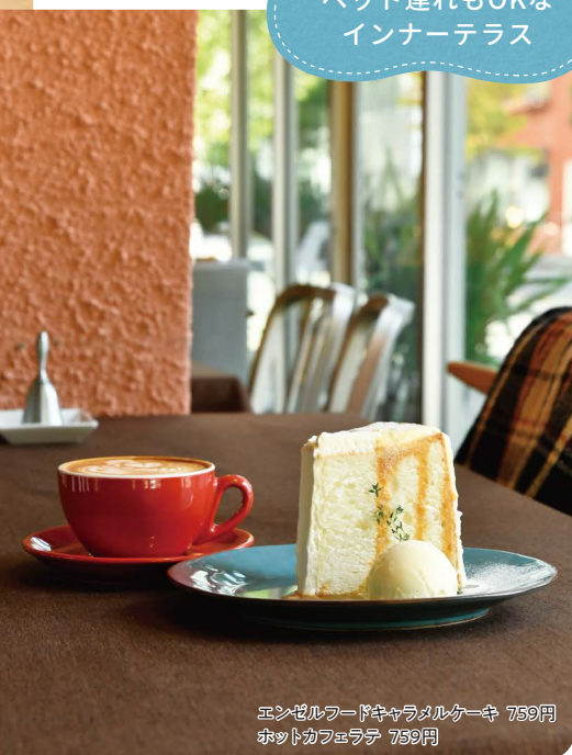
エンゼルフードキョロマルケーキ 759円 ポットカフェラテ 759円

パティシエが作るケーキはアメリカンカントリースタイル。名物のエンゼルフードケーキのふわふわ感を味わい、可愛いラテアートで温まりたい。