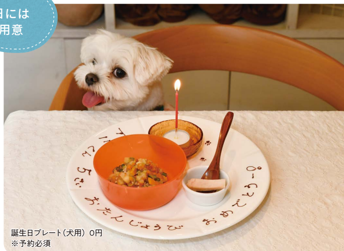
誕生日プレート(犬用) 0円 ※予約必須