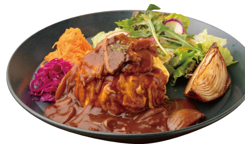
淡路島北坂養鶏場さくら卵使用 オムハヤシライスプレート 1,749円

☎箕面市船場東1-9-32 ☎072-727-5939 ①11:00~21:00(L020:00) ※金土日祝は~22:00 (L021:00) ※12/31は~16:00(L015:00) Ⓜ1/1 📍箕面船場阪大前駅2番出口から徒歩9分