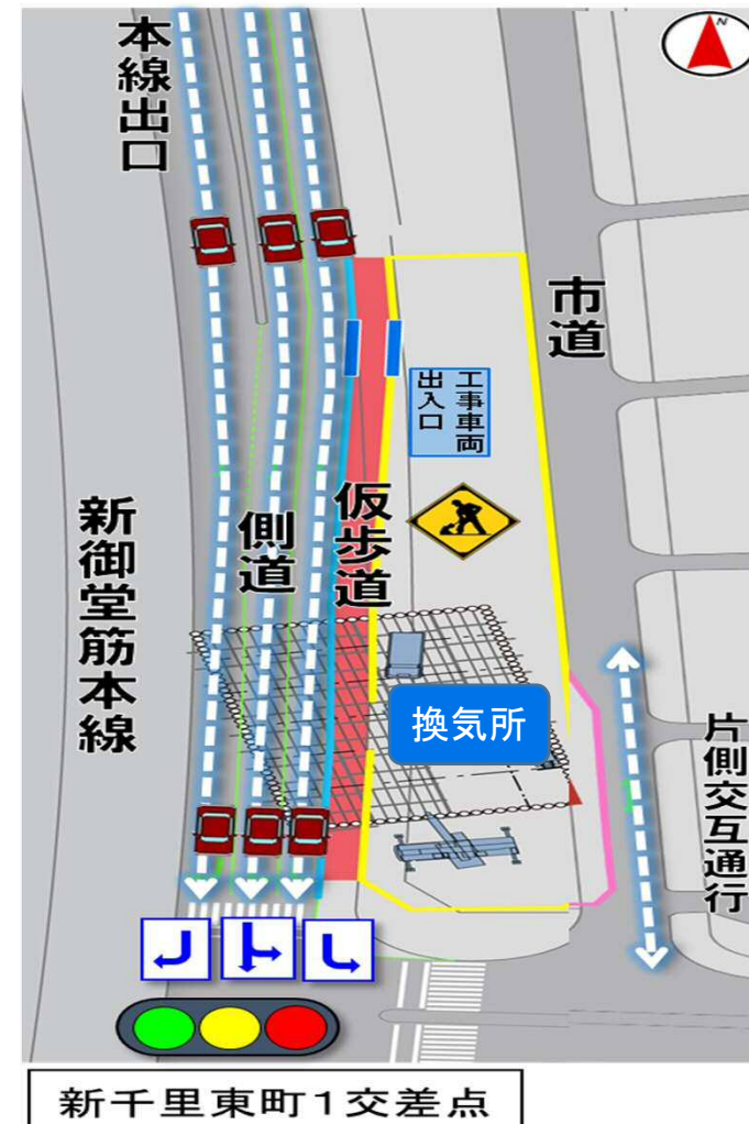
新千里東町1交差点