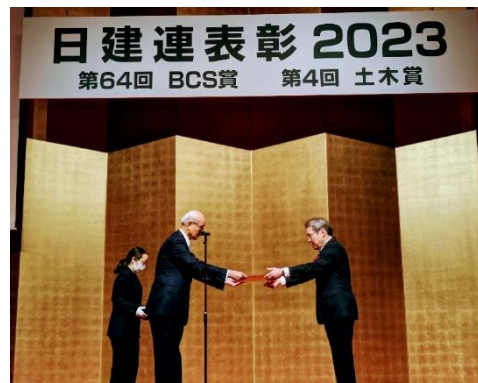
日本建設業連合会 宮本洋一会長より表彰を受けました