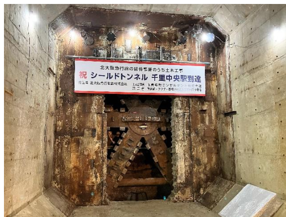
千里中央駅北端部に到達したシールドマシン