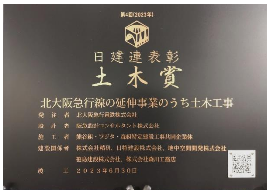
日建連表彰 2023「土木賞」受賞記念品

2024年3月23日（土）の南北線延伸線の開業に向けて引き続き安全第一で準備を進めて参ります。